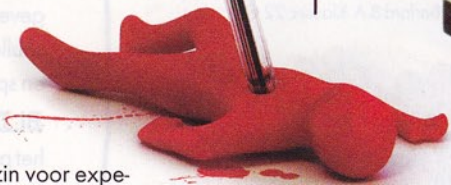
Penhouder 'Dead Fred', 9 €

WAT: Twee jonge gasten met gevoel voor humor en zin voor exper-