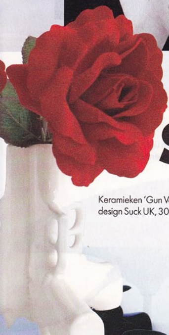
Keramiëken 'Gun Vase', design Suck UK, 30 €

14 karaat gouden 'Small Fortune' halsketting, design Lauren Haupt, 45 €